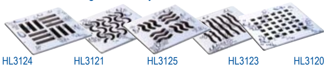
HL3124 HL3121 HL3125 HL3123 HL3120