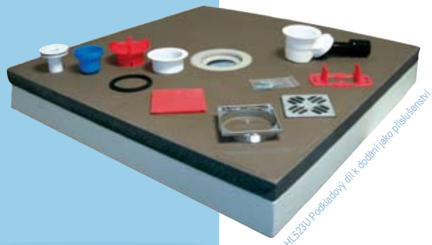
HL523U Podkladový díl k dodání jako příslušenství

Systémová deska pro sprchové kouty 90 x 90 cm, 120 x 120 cm